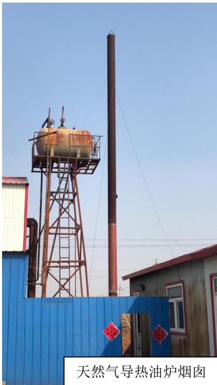
天然气导热油炉烟囱