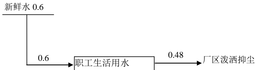
图 3-1 现有工程水平衡图 (单位: m 3 /d)